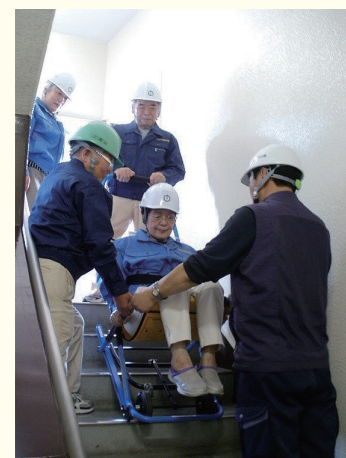
イーバックチェア訓練の様相

は、隊長（理事長）以下計 12 名で構成され、「自分たちのまちは自分たちで守る」の精神で住民と力を合わせ、行政機関と協力しながら地域住民の安全を図っています。