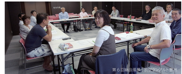
第6回総会風景：於グランアルト豊洲

今日、2020東京オリンピック・パラリンピックに向けて、また豊洲新市場を初めとした六丁目開発、東電堀には水陸両用バスやカーナーなどの設備ができ、まったく新しい様相となります。五丁目はその要に位置し、注目を浴びる地域の一つとなります。是非世界に誇れる街に、そしてなにより楽しい街にしようではありませんか。