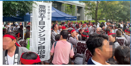
豊洲五丁目マンション自治会は初めて接待所を開設しました。

江戸三大祭りのひとつ、富岡八幡宮例大祭（深川八幡祭り）が6年ぶりに開催されました。53基の神輿が門前仲町永代通りに勢揃いし、深川地区を8kmにわたって一周。その後、豊洲町会神輿は豊洲に戻り町内巡行です。