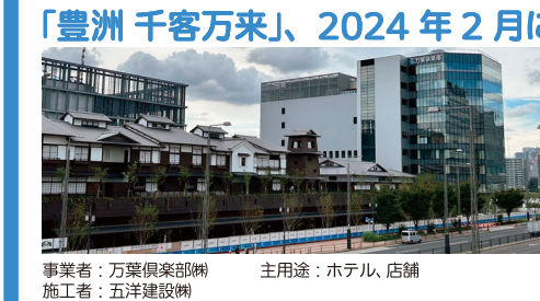
事業者：万葉倶楽部 施工者：五洋建設 主用途：ホテル、店舗

「豊洲千客万来」、2024年2月に全面開業 万葉倶楽部（神奈川県小田原市）は豊洲市場外に建設中の施設を「豊洲千客万来」として2024年2月1日に全面開業すると発表がありました。商業棟「豊洲場外江戸前市場」と温泉棟「東京豊洲万葉倶楽部」から構成されており、より一層の賑わい創出が期待されます。