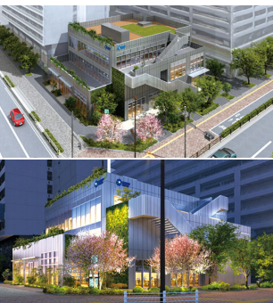
建築主：株式会社アースウインド 施工者：中島建工株式会社 用途：店舗

本年度、五丁目において新たな建設計画が始まりました。場所は昭和看護大学隣り五丁目交差点角の角です。豊洲五丁目地区地区計画に基づき、9回目となる景観検討会議が2022年11月に開催されました。この折、五丁目住民の意見により建設地にある桜の木の新緑が決定し、竣工イメージ図にも反映されました。事業者と住民による意義のある街づくり事例となりました。