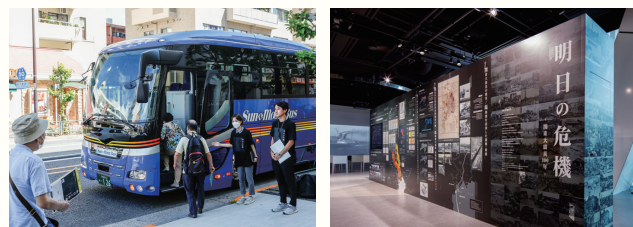
大島からの水害時事前避難訓練

また、9月の1か月間「交通防災展示」をミチノテラス豊洲で開催しました。自然災害の常襲地で、こうした節目に改めて災害に対する備えを考える展示内容でした。スマートシティ推進協議会：大村記