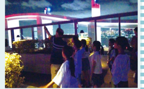
星空教室は4回目となりすっかりおなじみになりました