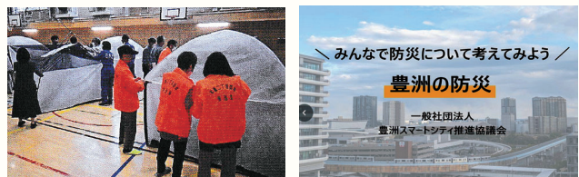
平小小学校での避難所開設・運営訓練 間仕切りテントによる居住スペース設営 防災意見の共有に使用する オンラインプラットフォームー豊洲の防災ー

当日の午後は本年度の地域防災訓練を西小体育館にて開催の予定です。今回のテーマは「みんなで防災について考えてみようー豊洲の防災ー」。避難所開設・運営訓練の報告を交えながら、防災意識や知識の共有を進められることを願っています。（小山）